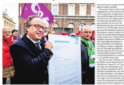
A Vakbonden pleiten bij minister Wouter Koolmees (Sociale Zaken) voor een goed pensioen.

Jan Oosterbeek Mensen moeten er voor zorgen dat de pensioenen niet afhankelijk worden gemaakt van de gekte op de financiële markten en de dubieuze oekopoprogramma's van de ECB. Het is belangrijk dat de pensioenen niet langer afhankelijk worden gemaakt van de gekte op de financiële markten en de dubieuze oekopoprogramma's van de ECB. Het is belangrijk dat de pensioenen niet langer afhankelijk worden gemaakt van de gekte op de financiële markten en de dubieuze oekopoprogramma's van de ECB.